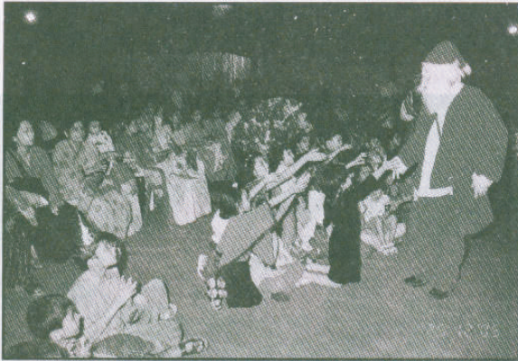
२५ डिसेंबर २००५ नाताळ