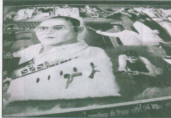
स्वातंत्र्यवीर सावरकर उत्सव