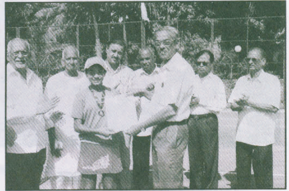
क्रीडा महोत्सव २००५ लॉन टेनिस स्पर्धा