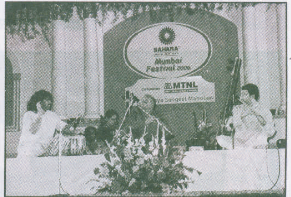
मुंबई फेस्टिवल २००६