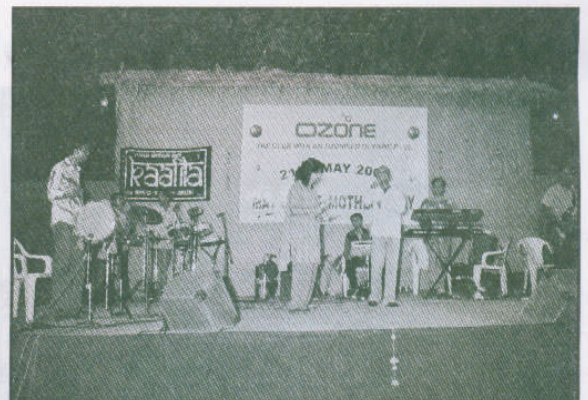
मे चॉल २००५ ओझोन क्लब