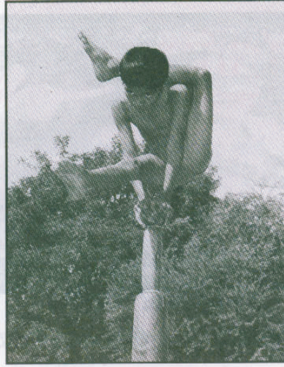
क्रीडा महोत्सव २००५ मल्लखांब