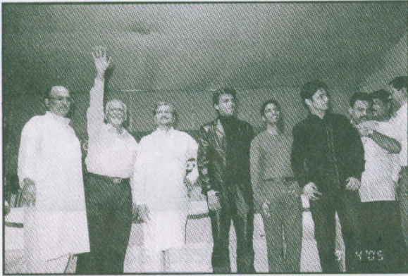
वर्धापन दिन २००५